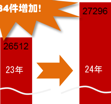
首都圏4労働局における労働災害発生件数